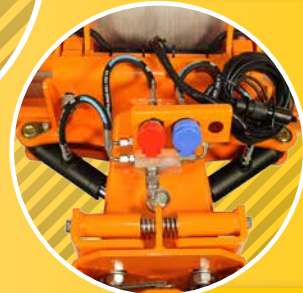
4 HYDR. WINKELVERSTELLUNG HYDR. ANGLE ADJUSTMENT REGLAGE HYDRAULIQUE DE L'ORIENTATION