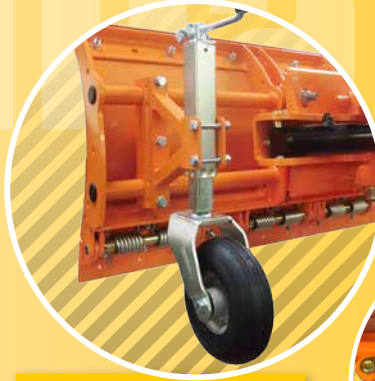
3 LAUFRÄDER CASTERS ROUES DE ROULEMENT