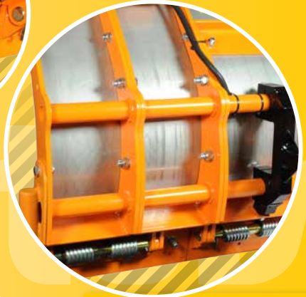
2 SEGMENTBAUWEISE SEGMENT METHOD OF CONSTRUCTION PRINCIPE DE SEGMENT