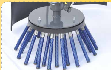
Verschiedene, einfach wechselbare Tellerbesen mit unterschiedlichen Besätzen erhältlich

height adjustable caster wheel for adjustment of brush pressure