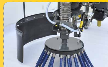
Optionales, einfach einstellbares Spritzschutzhut

Various, easily exchangeable circular brushes with different bristles available