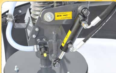
Bürstenkopf optional in zwei Achsen (rechts/links und vor/zurück) hydraulisch schwenkbar

Dank 700 mm Tellerbesen mit verschiedenen, wechselbaren Besätzen (Flachdraht oder Zopfbesatz), optionaler hydraulischer Neigungsfunktion des Bürstenkopfs, einem höhenverstellbaren Stützrad zur Einstellung des Bürstendrucks sowie dem optional erhältlichen Spritzschutz und Wassersprühleinrichtung passt sich die Maschine den unterschiedlichsten Untergründen und Bedingungen an und sorgt damit für ein optimales Ergebnis.