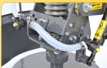
Optionale 110L-Wassersprühleinrichtung mit 2 Düsen zur Reduzierung des Staubeentwicklung

Optional, easily adjustable splash guard