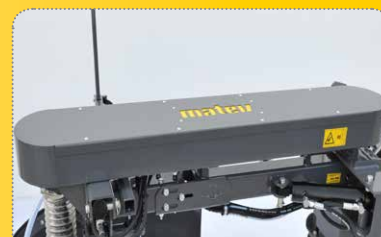
schlagdämpfender, leiser Riemenantrieb für 1.000 und 2.000 U/min

Optional 110 liters water sprinker system with 2 nozzles to reduce dust formation on dry surfaces.