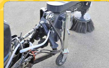
Stufenlos höhenverstellbares Laufrad zur Einstellung des Bürstendrucks

Brush head optionally hydraulically swiveling in two axes (right / left and forward / backward)