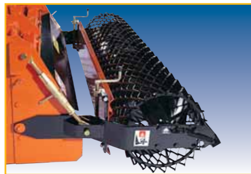
BARRA LIVELLATRICE POSTERIORE REAR LEVELLING BAR BARRE NIVELLEUSE ARRIÈRE HINTERE PRALISCHIENE ZADNĚ UROVNĚ VÁLCĚ SMYK

PER TRATTORI FINO A 80 HP FOR TRACTORS UP 80 HP POUR TRACTEURS JUSQU'À 80 CV FUER SCHLEPPER BIS 80 PS PRO TRAKTORY DO 80 HP