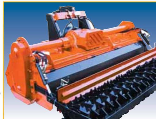
REGOLAZIONE PROFONDITÀ MEDIANTE CILINDRI IDRAULICI (A RICHIESTA SU MZ10 XL E MZ15 CX) WORKING DEPTH ADJUSTABLE THROUGH HYDRAULIC CYLINDERS (AVAILABLE ON DEMAND FOR MZ10 XL AND MZ15 CX) RÉGLAGE DE LA PROFONDEUR DE TRAVAIL PAR VERIN HYDRAULIQUE (DISPONIBLE EN OPTION SUR MZ10 XL ET MZ15 CX) EINSTELLUNG DES ARBEITSTIEFES DURCH HYDRAULISCHEN ZYLINDER (AUF WUNSCH AUF MZ10 XL UND MZ15 CX) NASTAVENĚ PRÁCOVNĚ HLUBKY POMOCÍ HYDRAULICKÝCH VÁLČŮ (NA PŮŽADÍ U MZ10 XL A MZ15 CX)