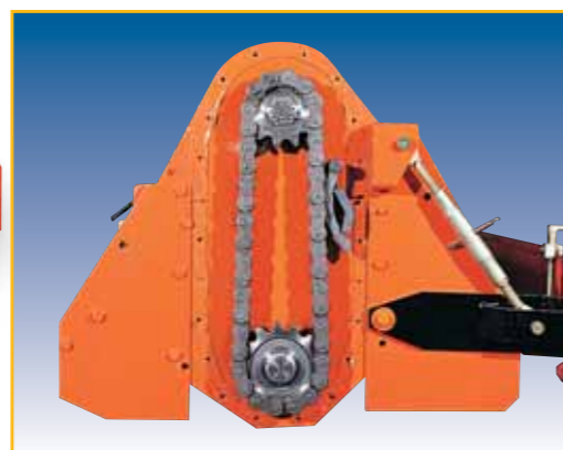
TRASMISSIONE A CATENA RINFORZATA (STANDARD SU MZ10 XL E MZ15 CX) REINFORCED SIDE TRANSMISSION CHAIN (STANDARD ON MZ10 XL E MZ15 CX) CHÂÎNE D'ENTRAÎNEMENT RENFORCÉE (STANDARD SUR MZ10 XL ET MZ15 CX) SEITLICHER ANTRIEB DURCH VERSTÄRKTER KETTE (AUF WUNSCH AUF MZ10 XL UND MZ15 CX) ZESKĚLENĚ BŮČNĚ PŘEVODOVÝ ŘETĚZY (STANDARDNÍ VÝBAVA U MZ10 XL A MZ15 CX)